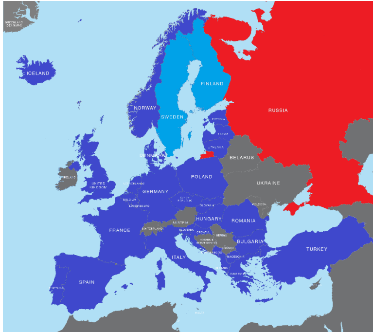
2. ábra: A NATO a finn és a svéd csatlakozás után (Az ábrát szerkesztették: a szerzők)

Európára? Változik-e a keleti (északi) tagállamokban állomásozó NATO-erők jellege, összetétele, feladata? Bővül-e a haditengerészeti jelenlét a Balti-tengeren? Milyen védelmi és elrettentési terveket alakít ki a NATO a kalinyingrádi orosz erőkkel szemben – és ezekben milyen szerepe lenne a skandináv államoknak? Természetesen egy még le nem zárt csatlakozási folyamat nem adhat minden kérdésre választ, de a közös gondolkodás a szövetség következő 10-15 évéről és a katonai képességek fejlesztéséről már ebben a közegben folyik.