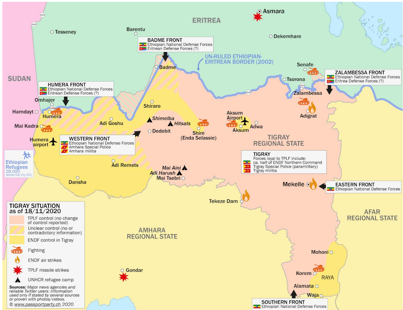
A tigráji harcok helyzete 2020. november 18-án.

vezetett. 62 Az előrenyomulás során derült fény a konfliktus egyik legborzalmasabb epizódjára, a Himéra közelében, Mai Kadra településen elkövetett mészárlásra, melynek során a TPLF-hez köthető fegyveresek legalább 500 civilt, zömében amharákat mészároltak le. 63